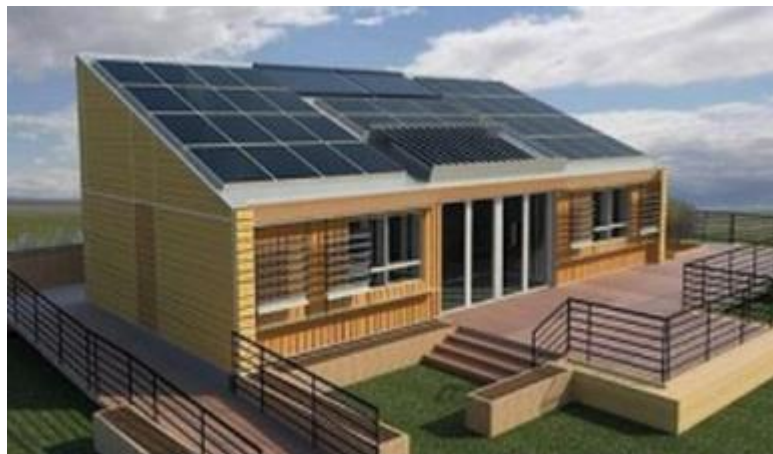
Les maisons en bois 100 % autonomes (Solaire & Eolien)

Nous utilisons pour nos applications photovoltaïques, des panneaux solaires fabriqués dans nos usines en Chine et en Allemagne. De plus, ce qui différencie aussi le Groupe SM Devis International des autres sociétés concurrents dans le secteur des énergies renouvelables, c'est sa force à mobiliser rapidement des équipes de technicien sur place, ainsi que le suivi commercial (Formation, étude de marché, suivi commercial etc...) afin de répondre aux besoins des différents partenaires distributeur dans n'importe quel pays du monde.