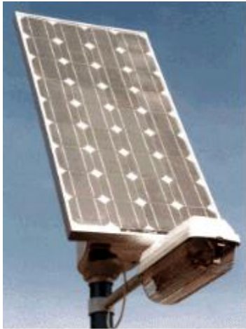
Les lampadaires solaires avec panneaux publicité éclairés à l'énergie Solaire