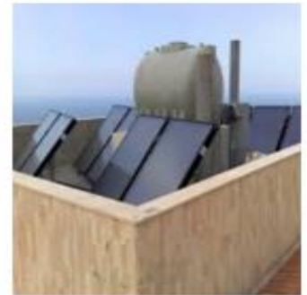
Solaire Thermique Liban