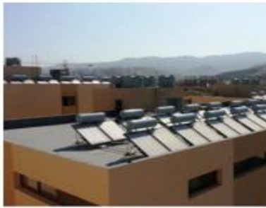
Installation de Chauffe Eau Solaire Tanger (Maroc)