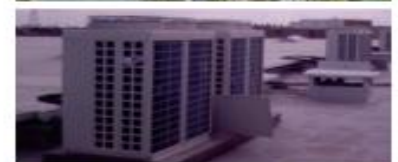
High Standing Residential Projet VRV Climatiseur Central Résidentiel Dakar ( Sénégal)