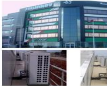
Projet de FUJIFILM Multi Split Climatiseur Traditionnel au R25 (VRV-AC) Tunisia